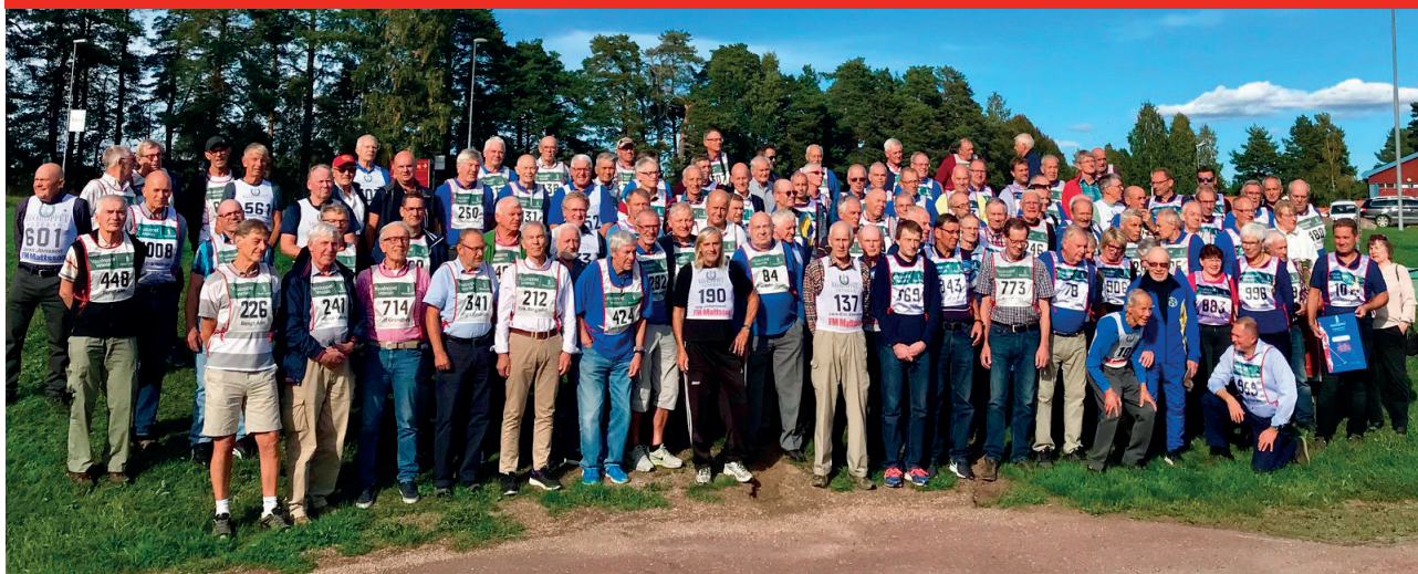
Årsmötet på Moraparken 2018