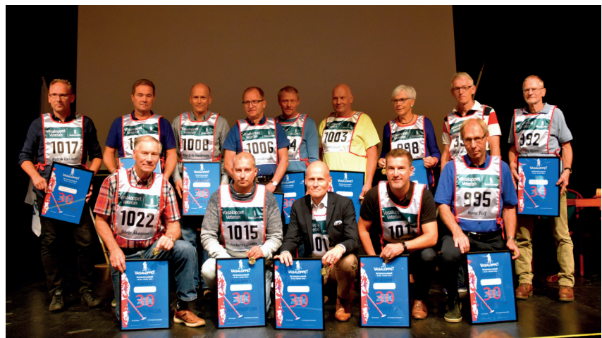
Ett gäng 30-loppare