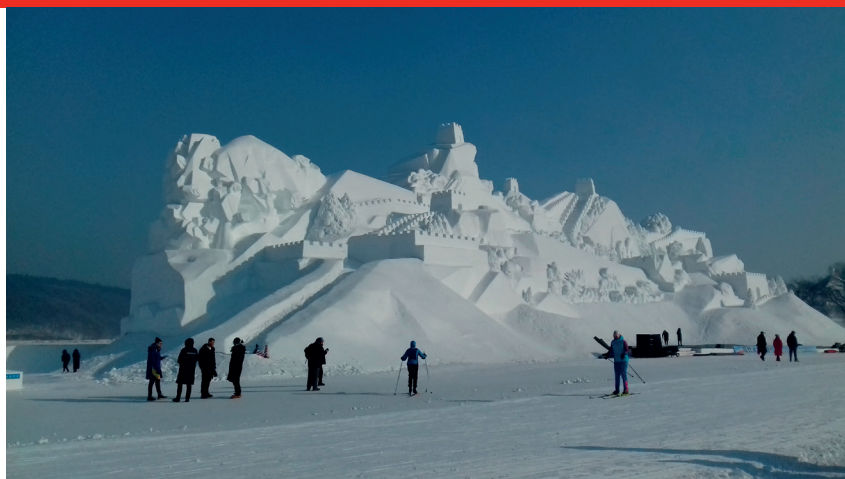
Spektakulär inramning av startfältet med hundratalet snöskulpturer

Loppet hade lockat några hundratal utländska åkare och en stor del av