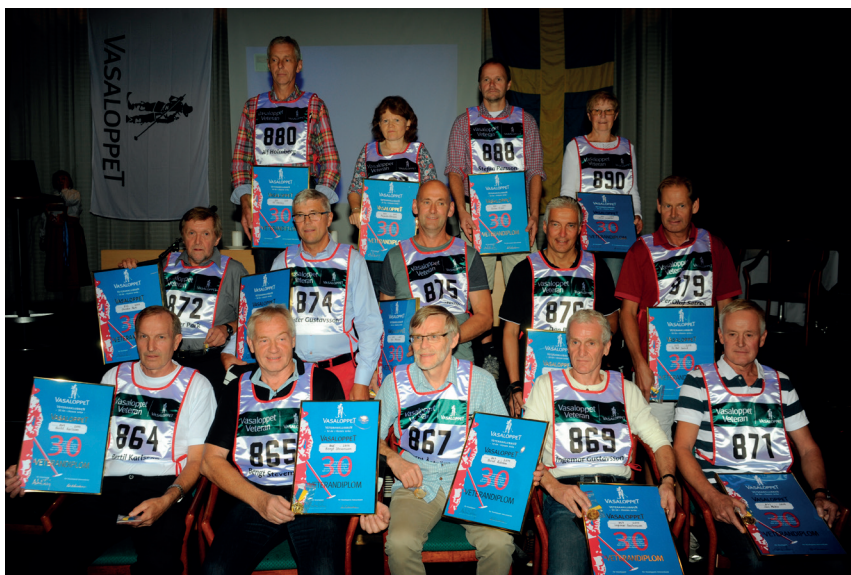
Gäng nr 2 av 30-loppare från årsmötet 2014