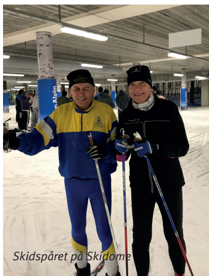
Skidspåret på Skidome