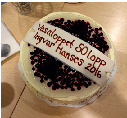
En av 50-lopparnas belöning - tårtkalas!

Vasaloppsveteran och medlem i Vasaloppets Veteranklubb är faktiskt inte samma sak, vilket kanske bör klargöras. Vasaloppet registrerar alla löpare enligt de bestämmelser som man som arrangör har tillika med Svenska Skidförbundet. Här finns t ex regeln att man ska ha genomfört