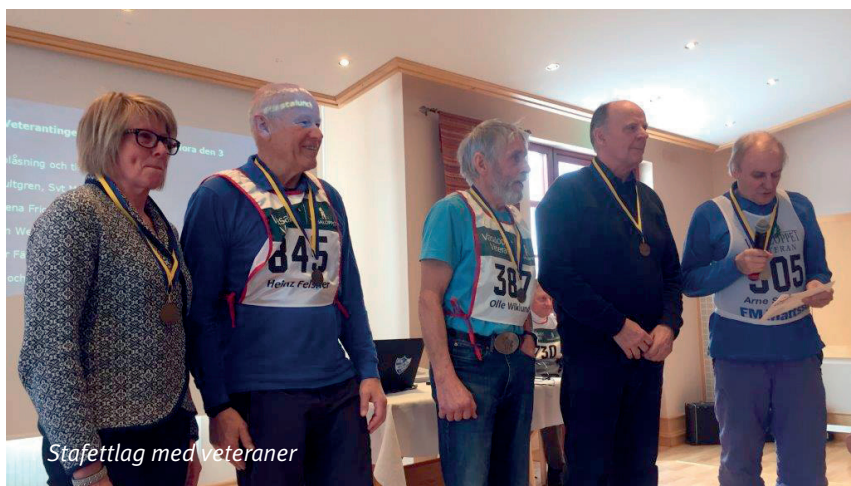
Stafettlag med veteraner