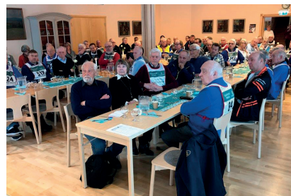
Veterantinget samlade många veteraner

lag, det långsammare laget gick in bland de bästa 2/3-delarna. Det långsammare laget hade med stor sannolikhet kunnat åka betydligt snabbare, men en växlingsmiss ställde till det. De flesta av oss vasaloppsveteraner har naturligtvis efter minst trettio års vasalopp bakom sig visat sig ha en hel del "tävlingsinstinkt" i generna men att åka StafettVasan är en upplevelse av lite annat slag. Här är betydligt mindre av tävlings-hets men väsentligt mer av gott kamratskap inom laget och en vilja att fullfölja med kroppen i gott skick hellre än att pressa sig mot sitt maximum. Organisationen runt StafettVasan är numera "väloljad"! Att på äldre dagar ta en plats i ett av stafettlagen kan absolut rekommenderas.